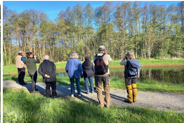
Vid Ödet med omnejd, Torsås